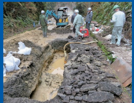
能登半島地震での応急復旧活動を行っています