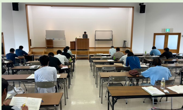
主任技術者試験準備講習会（福島県連）