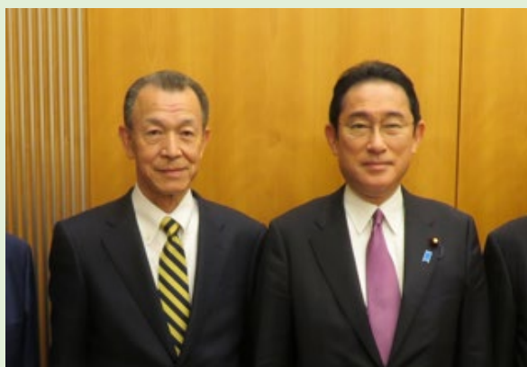
藤川会長（左）と岸田内閣総理大臣