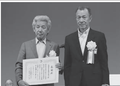
開催地・愛媛県連への感謝状 表彰(敬称略・順不同)