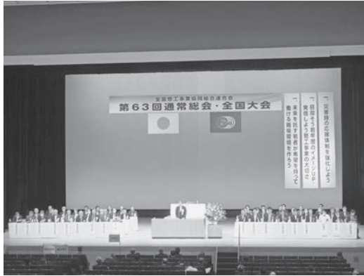
全国から650名が参集した 通常総会・全国大会 (愛媛県松山市の愛媛県民文化会館)