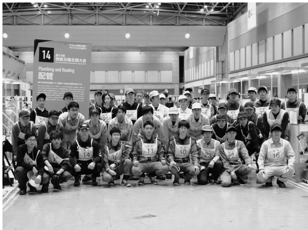
次代を担う青年技能者たち