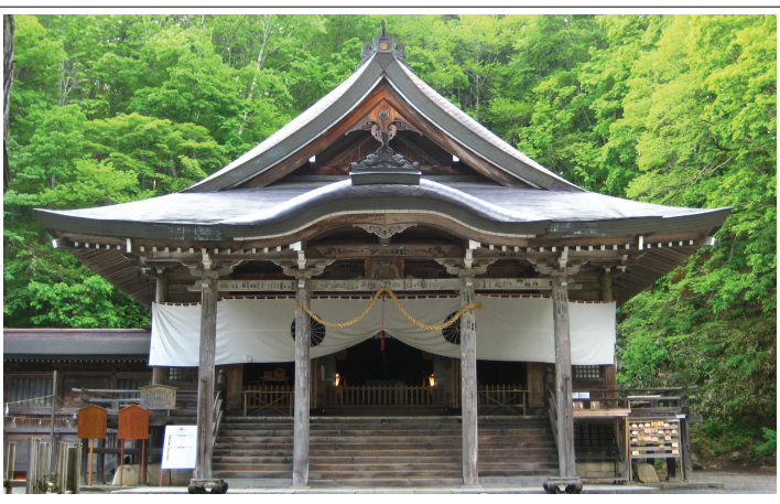
戸隠神社中社(長野市)

どもまらない衆知を集めて、議論を深めてまいりました。組織改正はゴールではなく、よりコンパクトな組織で風通し良く議論を行い、会員、所属企業の発展につながる事業を展開していく全管連となるための出発点であると考えています。言うまでもなく、給排水設備、水道配水管、空調設備などの工事は、国民生活と社会経済活動を支える不可欠な工事であり、我々は確かな技術力でそれらを提供してまいりましたが、取り巻く社会環境も大きく変化しております。二点目は、社会的な貢献を果たすことです。私たち企業、組合は、地域から信頼される存在となることが不可欠です。そのためにも地元水道事業体等関係機関との連携を強化し、地震等の緊急時には真摯に先に応急復旧に駆け付け、そのことを地域にアピールすべきです。地域に根差し、社会的にも信頼されるという非組合員との違いを明確にするとともに、広報活動を積極的にを行い、管工事業界のイメージアップを図り、若者の入職促進にも繋げたいと思っています。三点目は、水道事業における官民連携事業の推進を進めるうえで、地域の管工事業組合がその役割を果たせるよう、事業体のパートナーとして活用していただけるような体制であるということです。