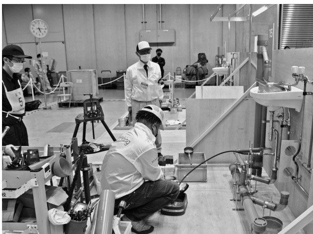
公開水圧審査の様子