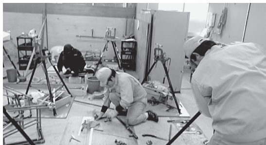
技能検定受検のために練習に励む生徒たち（写真上左から時計まわりに）男鹿工高、大阪布施工高、広島工高、熊本小川工高