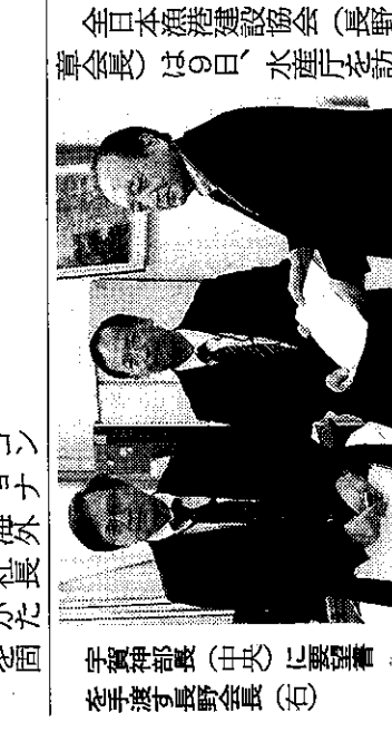
全日本漁港建設協会(長野)の役員ら